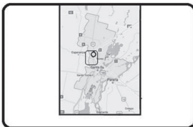
Imagen 1: Ubicación de Campo San José en el departamento La Capital, Provincia de Santa Fe, Argentina